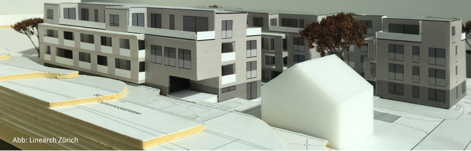
Abb: Linearch Zürich